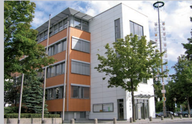
Stefan Kolbe 1. Bürgermeister